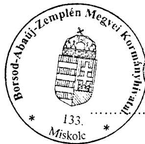
Demeter Ervin kormány megbízott